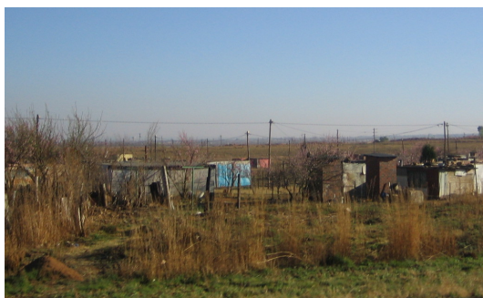
Abbildung 1: Hütten in Magagula Heights

Magagula Heights ist ein kleines Township etwa 30 Kilometer südöstlich von Johannesburg, der größten und gleichzeitig gefährlichsten Stadt Südafrikas, die Kriminalitätsrate ist dort landesweit am höchsten. Vor einigen Jahren übertraf hier noch die Anzahl der Morde jene der Verkehrstoten. Mittlerweile hat sich die Lage aufgrund erhöhter Polizeipräsenz aber deutlich verbessert.