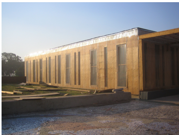
Abbildung 3: der erste Klassenraum

Anfang des Jahres 2008 wurde in der Nähe von Magagula Heights das Ithuba Skills College eröffnet, eine Privatschule für 14- bis 19-Jährige (siehe Abbildung 3). Bis zur Eröffnungsfeier war es ein langer Weg. Das Aufbringen der ersten Spendengelder, das Überwinden bürokratischer Hürden und das Ingang- und Umsetzen der Vision von einer besseren Schule waren mühsame, wenngleich notwendige Handlungen. Das Gelände, auf dem die Schule heute steht, wurde von einem österreichischen Unternehmer in Südafrika zur Verfügung gestellt.