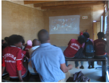
Abbildung 8: Schul kino

Als erwähnenswertes Projekt während unseres Aufenthaltes ist auch die Inbetriebnahme eines kleinen „Schulkinos“ (Abbildung 8) zu nennen. Beamer, DVD-Player und Boxen wurden ebenfalls durch Spendengelder finanziert, als Projektionsfläche wurde ein Leintuch an der Wand der Schulklasse befestigt. Dieses Kino kann einerseits als Treffpunkt und Kommunikationszentrum für den Nachmittag, aber auch als ergänzendes Wissensvermittlungsmedium zu gerade behandelten Unterrichtsinhalten genutzt werden.