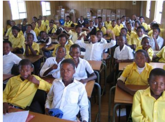
Abbildung 2: überfüllte Klassenzimmer

Klassengrößen von etwa 60 sind wie schon erwähnt gang und gäbe (siehe Abbildung 2), über die Qualität des Unterrichts bräuchte man angesichts dessen gar nicht zu sprechen. Viele der Absolventen der Pflichtschule haben Probleme mit den Grundrechnungsarten, von einer gediegenen Mathematikausbildung ganz zu schweigen. Eine kleine Randnotiz an dieser Stelle: Einige Lehrer nutzen die Unterrichtszeit, um sich etwas Taschengeld dazuzuverdienen, indem sie Süßigkeiten und Popcorn an ihre Schülerinnen und Schüler verkaufen.