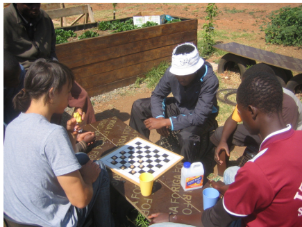
Abbildung 9: Pausengestaltung

Im Tagesablauf gibt es eigentlich nur eine festgelegte, dafür sehr ausgedehnte Pause. In dieser Zeit haben die Schülerinnen und Schüler gewisse Pflichten zu erledigen.